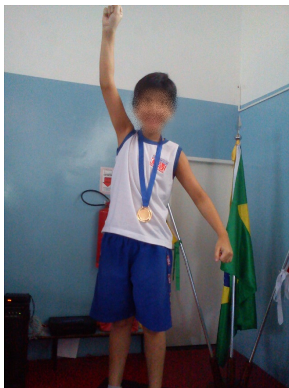
Figura 2 - Jogos Internos